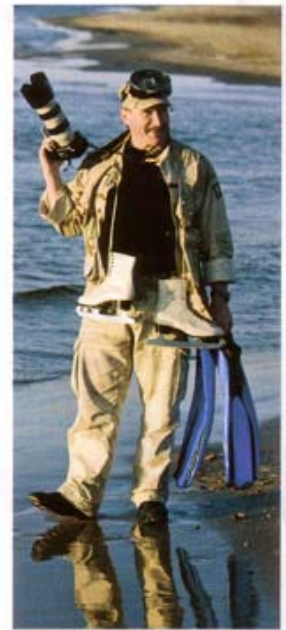
РАБОЧИЙ МОМЕНТ. НА ПЛЯЖЕ С КОНЬКАМИ И ЛАСТАМИ

«Я обожаю, когда модель стесняется. Как тогда играют глаза! Меня больше огорчает, когда женщина, не успев прийти,