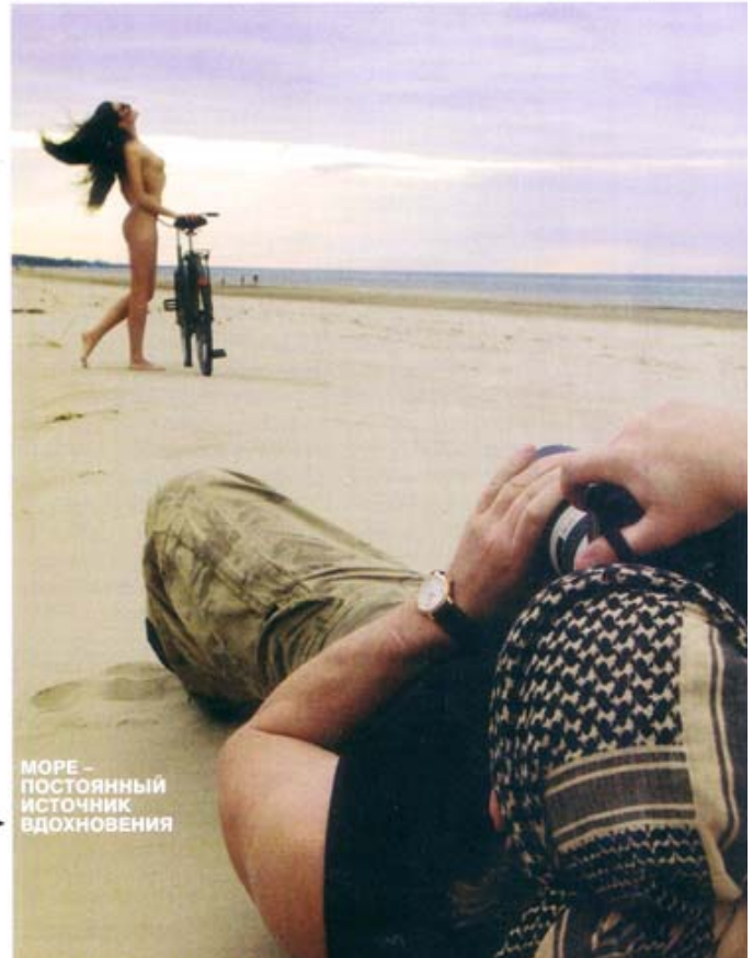
МОРЕ – ПОСТОЯННЫЙ ИСТОЧНИК ВДОХНОВЕНИЯ