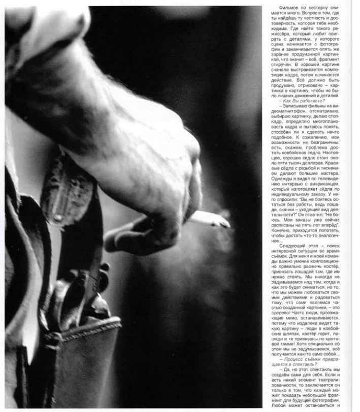
ФОТОГРАФИИ 11'2001 74

скромностью не обременён. Но убедиться, действительно ли этот человек обладает замышленной самооценкой, мы не можем, поскольку пока не вошли в его съёмочную группу. Может, он и впрямую душа компанейский? Со Архиповым мы знакомы с его собственными словами. И вот что он рассказывает.